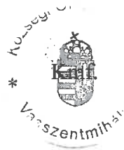
Császár István polgármester

A polgármester a beszámoló felolvasása után a közmeghallgatás ülését 18:20 órakor bezárta